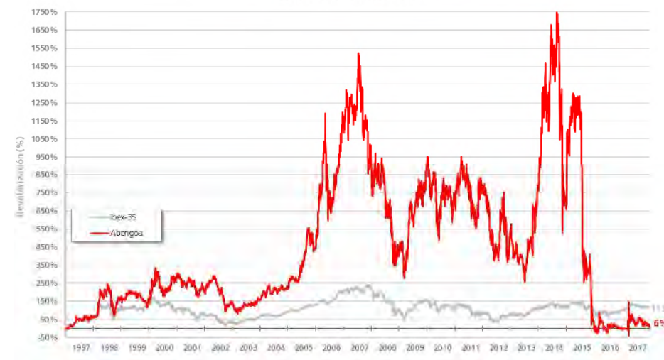
Evolución de la Capitalización de Abengoa en Bolsa (comparado con Ibex-35)

Desde su salida a Bolsa, el 29 de noviembre de 1996, el valor de la Compañía se ha revalorizado un 6% respecto al valor inicial. Durante este mismo periodo de tiempo, el selectivo IBEX-35 se ha revalorizado un 115%.