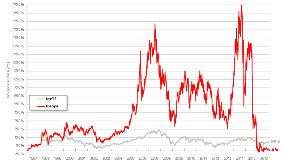
Evolución de la Capitalización de Abengoa en Bolsa (comparado con Ibex-35)

La última cotización de las acciones de Abengoa en 2016 ha sido de 0,40 euros en la acción A, un -2% inferior respecto al cierre del ejercicio 2015 y de 0,19 euros en la acción B, un -4% inferior respecto al cierre del ejercicio 2015.