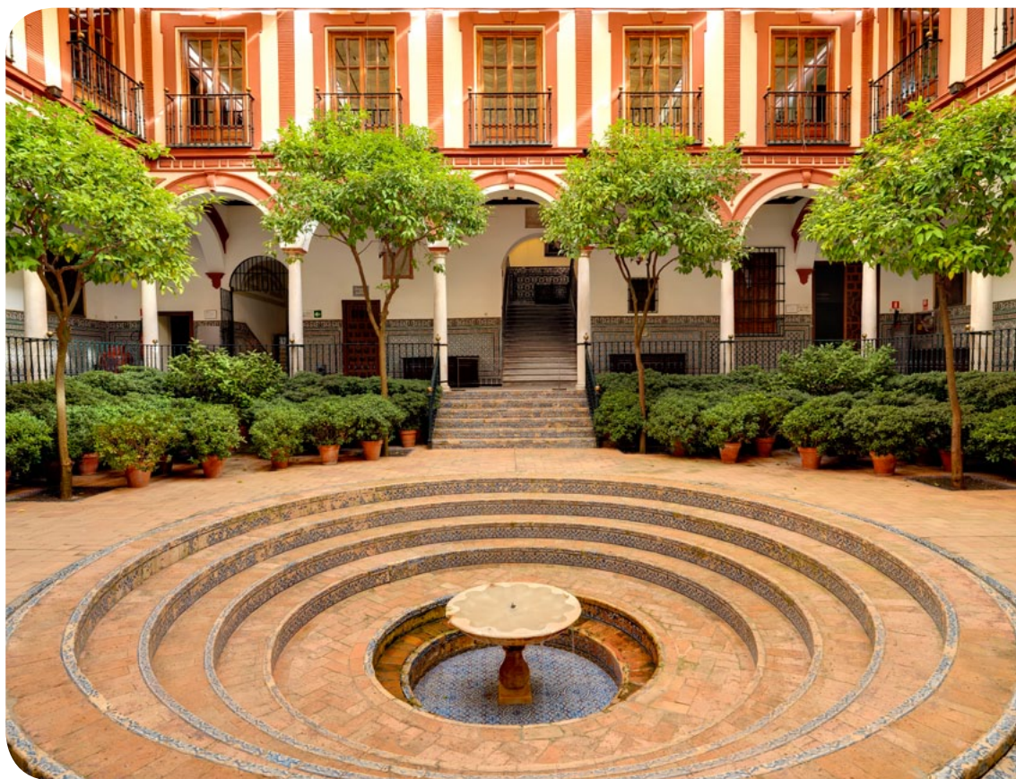
Hospital de los Venerables: sede de la Fundación Focus-Abengoa.

A través de la Fundación Focus-Abengoa la organización orienta sus líneas estratégicas a la generación de valor en las geografías donde desarrolla su actividad. El objetivo de las actividades que la fundación lleva a cabo, desde su creación hace casi 30 años, es mejorar las condiciones de vida de los colectivos más desfavorecidos a través del desarrollo social, la educación, el enraizamiento local, la investigación y la divulgación científico-cultural del patrimonio de la Fundación, desde una perspectiva humanista y tecnológica.