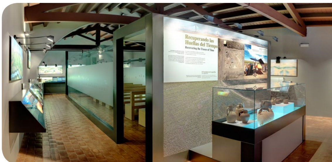
Sala de exposición del Campus Focus-Abengoa.

Este paisaje protegido es el resultado de la recuperación de las tierras afectadas por los vertidos de lodos tóxicos debido a la rotura de la balsa minera de Aznalcóllar, Sevilla, en 1998.