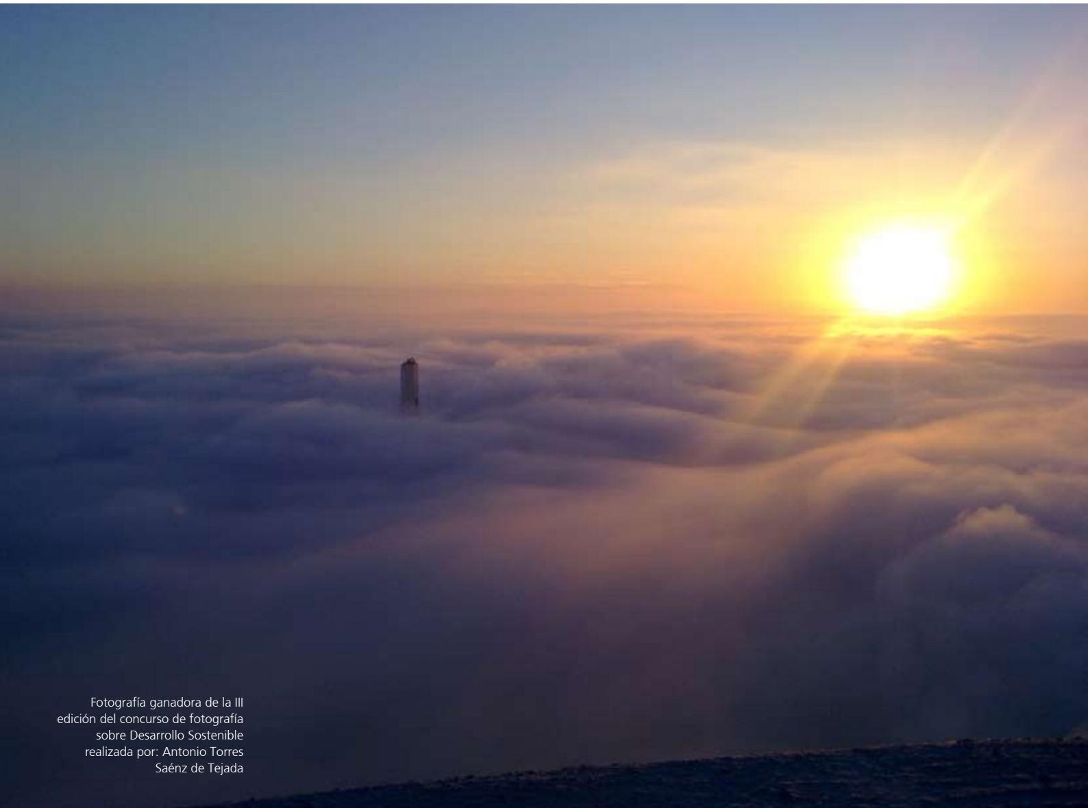
Fotografía ganadora de la III edición del concurso de fotografía sobre Desarrollo Sostenible

En este sentido, la búsqueda de la sostenibilidad tiene un papel fundamental en la evolución del tejido empresarial de todo el mundo hacia el progreso de la humanidad. Las empresas deben asegurarse de que los impactos derivados de su actividad sean positivos para la sociedad y para el medioambiente, y deben hacerlo mediante un comportamiento ético y transparente que contribuya al bienestar de todos. Es imprescindible que las organizaciones valoren y tengan en cuenta su entorno a la hora de tomar decisiones.