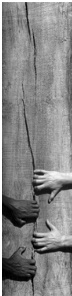
Foto realizada por Daniel Romero Delrue , de Befesa, para el I Concurso de Fotografía de Abengoa sobre Desarrollo Sostenible.

Los canales de diálogo recogidos en este cuadro son para Abengoa el instrumento idóneo para lograr el intercambio de información con sus grupos de interés. Buena parte de estas vías de diálogo son gestionadas directamente por los departamentos y los responsables, que mantienen con cada grupo una relación habitual. Sin embargo, el fin último es que todas las opiniones, sugerencias, consideraciones y quejas que a diario recogen los interlocutores de Abengoa calen en la estrategia de la Compañía. Por ello, esta información se analiza y las conclusiones se replican en toda la organización. En definitiva, los canales de diálogo estables que fomenta Abengoa con sus grupos de interés persiguen definir un modelo de mejora transversal que responda a las expectativas de todos ellos y que esté alineado con la visión y con la misión de la Compañía.