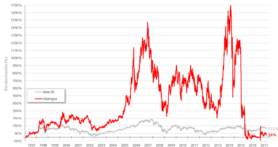
Evolución de la Capitalización de Abengoa en Bolsa (comparado con Ibex-35)

Desde su salida a Bolsa, el 29 de noviembre de 1996, el valor de la Compañía se ha revalorizado un 26% respecto al valor inicial. Durante este mismo periodo de tiempo, el selectivo IBEX-35 se ha revalorizado un 122%.